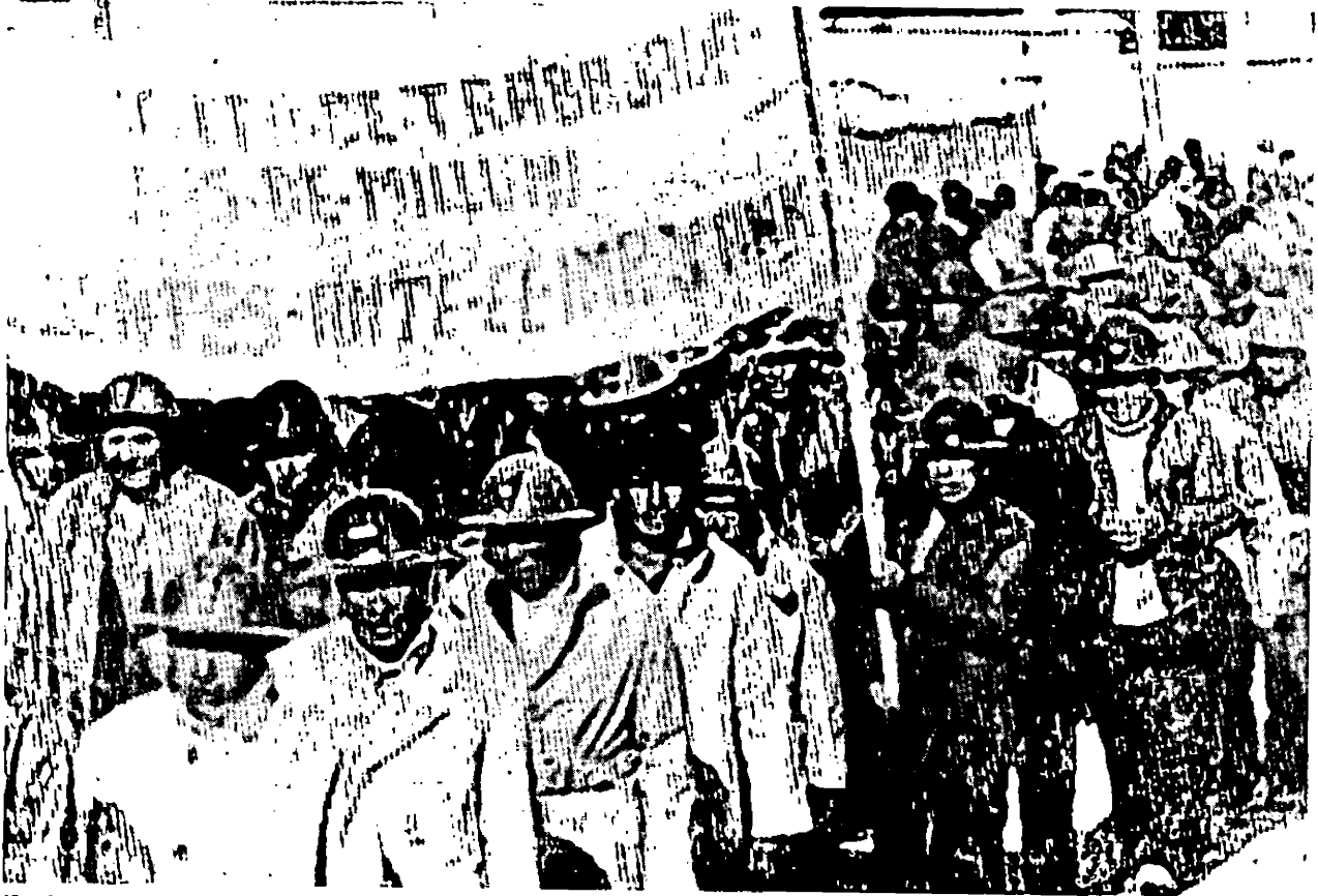
En haut : manifestation de mineurs sous le gouvernement Torres.